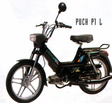
PUCH PI L

Automatikmofa, Best.-Nr. 255 Höchstgeschw. lt. StVZO 25 km/h