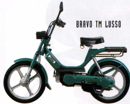
BRAVO TM LUSSO

Automatikmofa, Best.-Nr. 326 Höchstgeschw. lt. StVZO 25 km/h