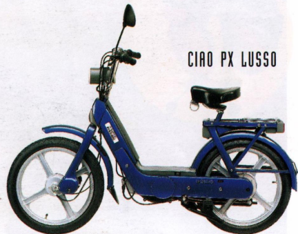
CIAO PX LUSSO

Automatikmofa, Best.-Nr. 336 Höchstgeschw. lt. StVZO 25 km/h