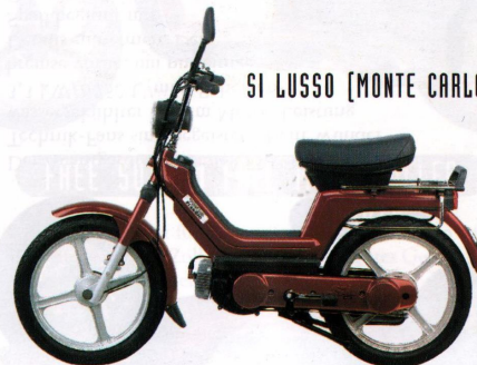
SI LUSSO (MONTE CARLO)

Automatikmofa, Best.-Nr. 349 Höchstgeschw. lt. StVZO 25 km/h