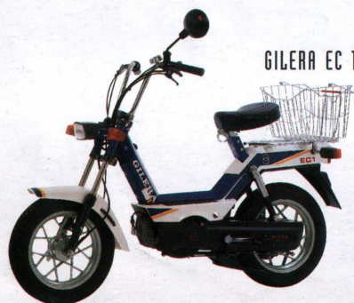
GILERA EC 1

Automatikmofa, Best.-Nr. 698 Höchstgeschw. lt. StVZO 25 km/h